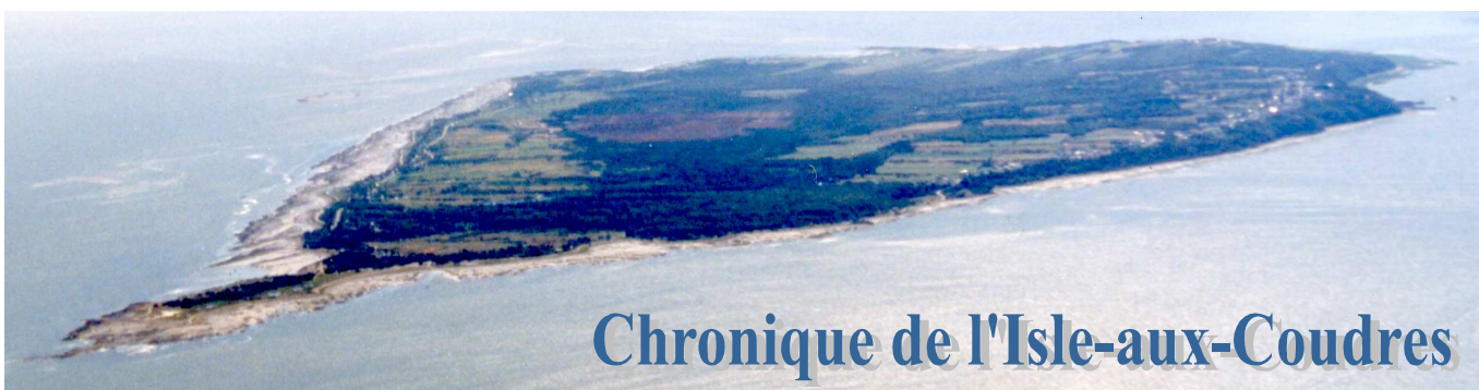
L'Isle-aux-Coudres. Photo : Marlène Dufour, 1996.

Volume 10, numéro 4, juillet - août 2010