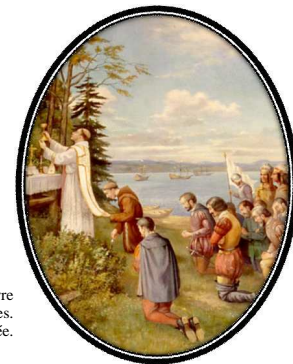
Tableau d'Antonio Masselotte représentant la première messe célébrée à l'Isle-aux-Coudres, le 7 septembre 1535. Oeuvre réalisée en 1930 pour l'église de Saint-Bernard-sur-Mer de l'Isle-aux-Coudres. Collection privée.

Fêtes commémoratives de la découverte de l'Isle-aux-Coudres par Jacques Cartier et de la première messe célébrée à l'intérieur des terres du Canada, les 6 et 7 septembre 1535.