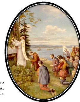
Tableau d'Antonio Masselotte représentant la première messe célébrée à l'Isle-aux-Coudres, le 7 septembre 1535. Oeuvre réalisée en 1930 pour l'église de Saint-Bernard-sur-Mer de l'Isle-aux-Coudres. Collection privée.

Fêtes commémoratives de la découverte de l'Isle-aux-Coudres par Jacques Cartier et de la première messe célébrée à l'intérieur des terres du Canada, les 6 et 7 septembre 1535.